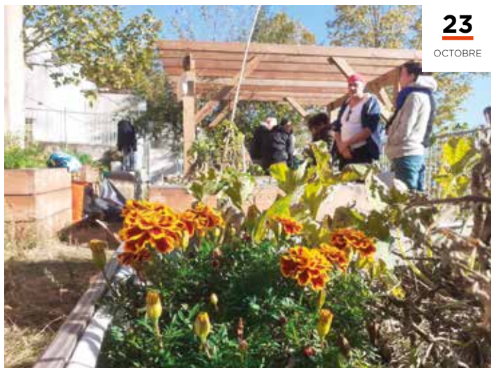
Inauguration du "Jardin des Lilas", jardin partagé du quartier de Bissardon