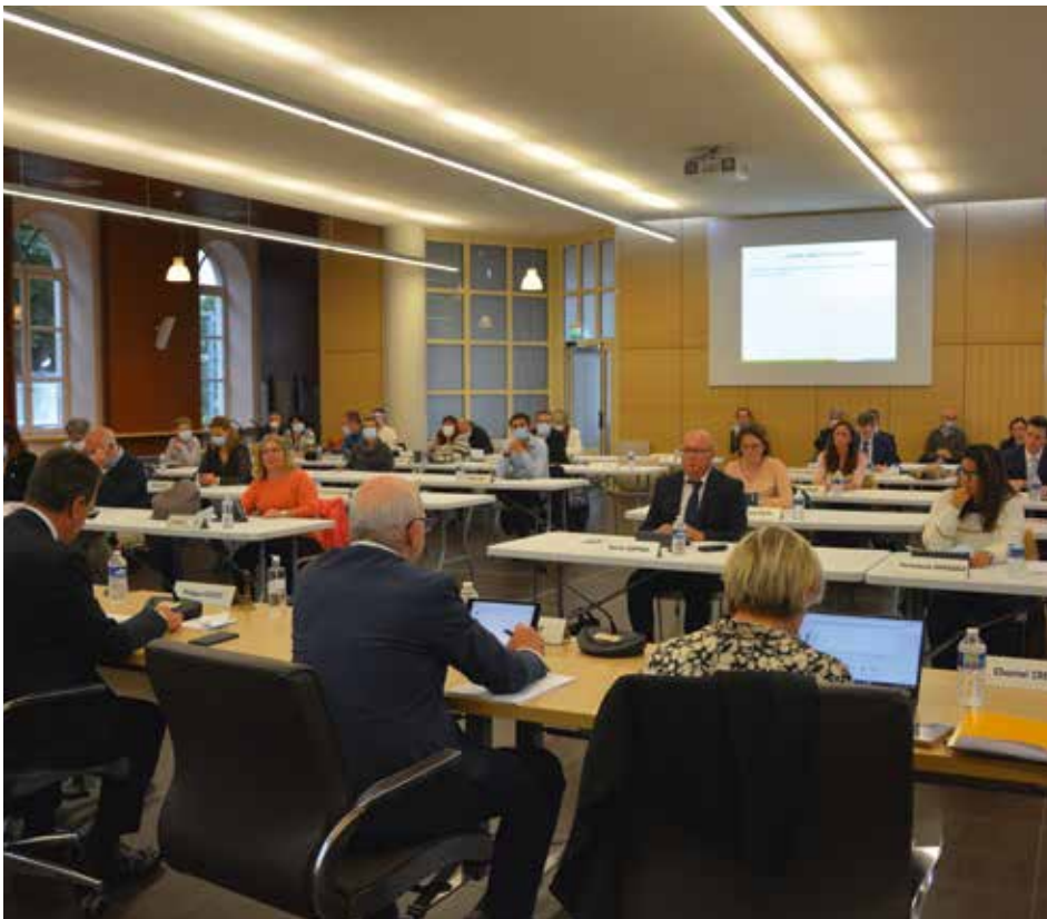
Séance du conseil municipal du 9/06