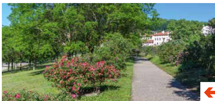
La Roseraie, de Saint-Clair.