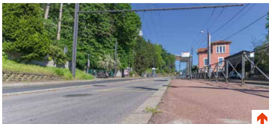
La montée des Soldats.