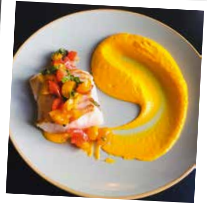
Dos de cabillaud rôti

Préchauffez le four à 200 degrés ou thermostat 6 (chaleur tournante) Chauffez la poêle avec un peu d'huile d'olive et colorez le poisson côté peau. Débarrassez sur une plaque de cuisson côté peau vers le haut, salez, poivrez et versez un peu d'huile d'olive. Finissez la cuisson au four pendant 6 à 8 min en fonction de l'épaisseur du poisson. Dressez l'assiette avec la mousseline, le poisson et la sauce dessus.