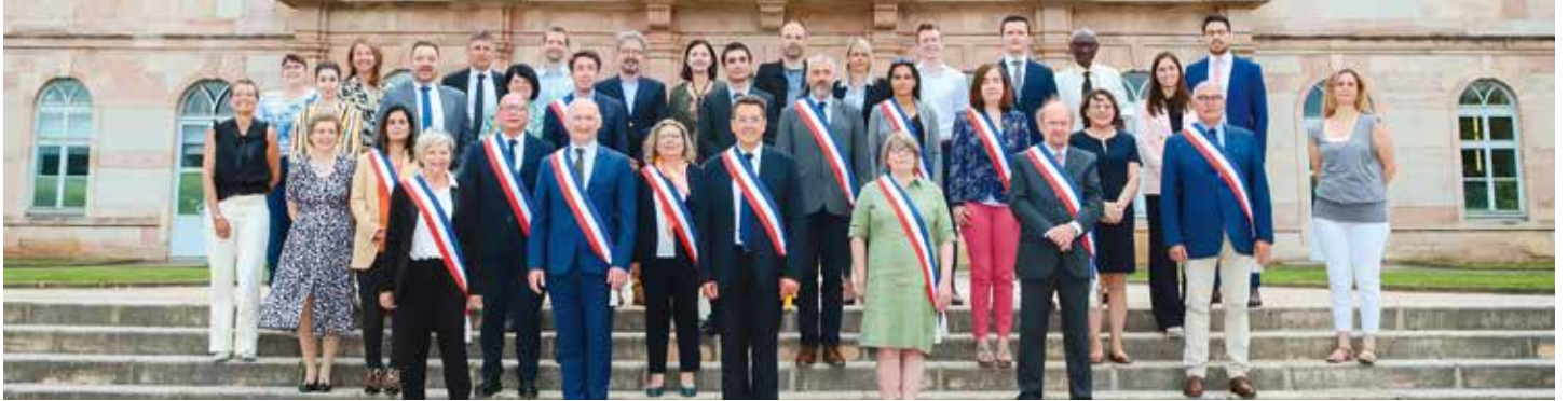
Le Maire, les adjoints et la nouvelle majorité municipale