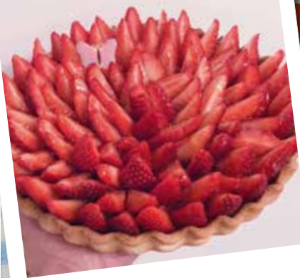
Tarte aux fraises