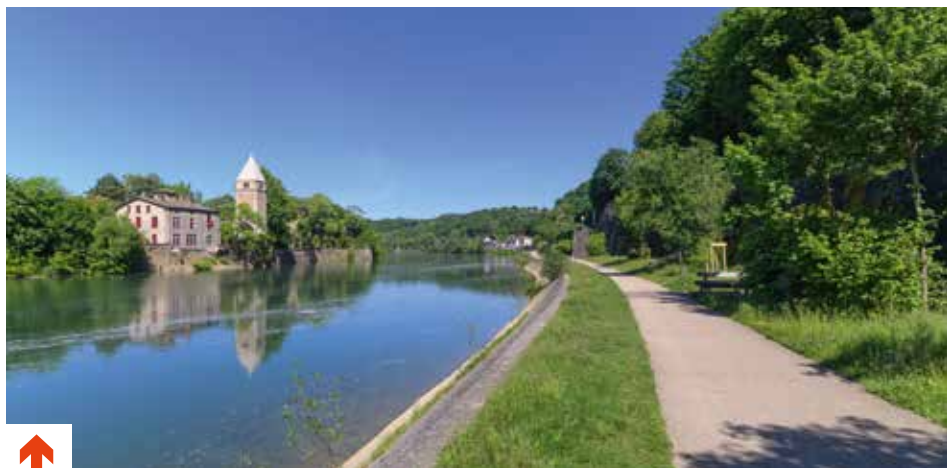
Les berges de la Saône.