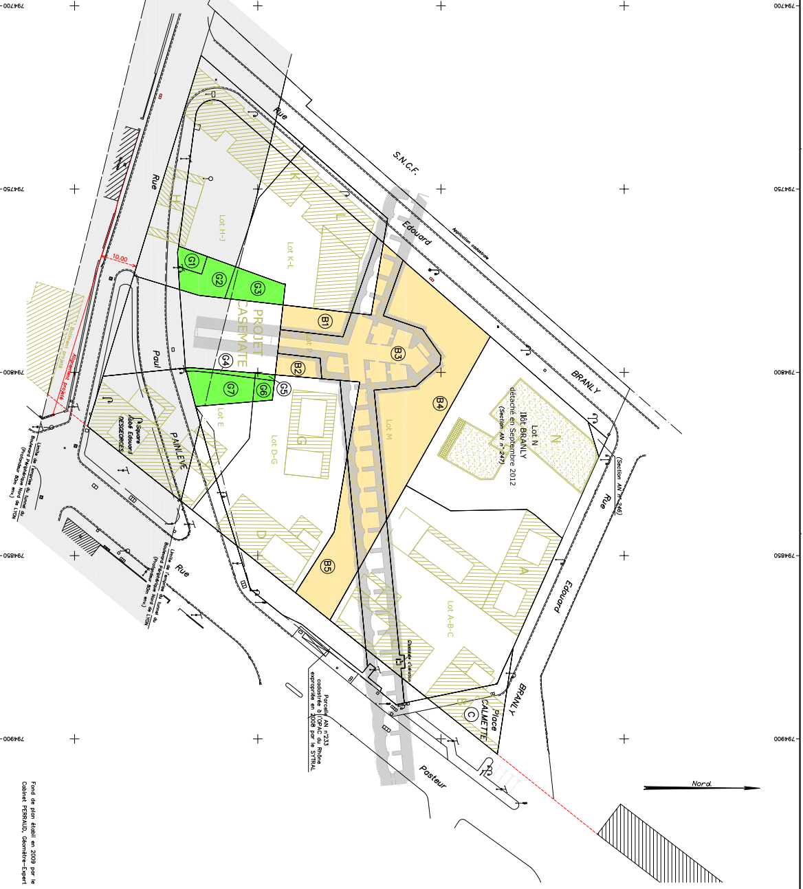
Volumes appartenant à la VILLE et cédés à l'OPAC DU RHONE :