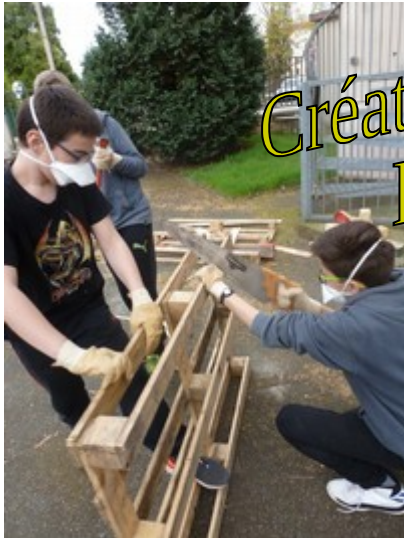
Création de meubles En palettes