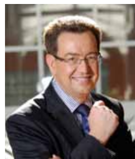
Philippe Cochet Député-Maire de Caluire et Cuire

Fière de ses huit quartiers, Caluire et Cuire voit en chacun d'eux des atouts et des spécificités qui les rendent uniques et méritent d'être mis en valeur. Guidée par cette ambition, notre équipe municipale multiplie les efforts pour les embellir et les rendre toujours plus agréables à vivre.